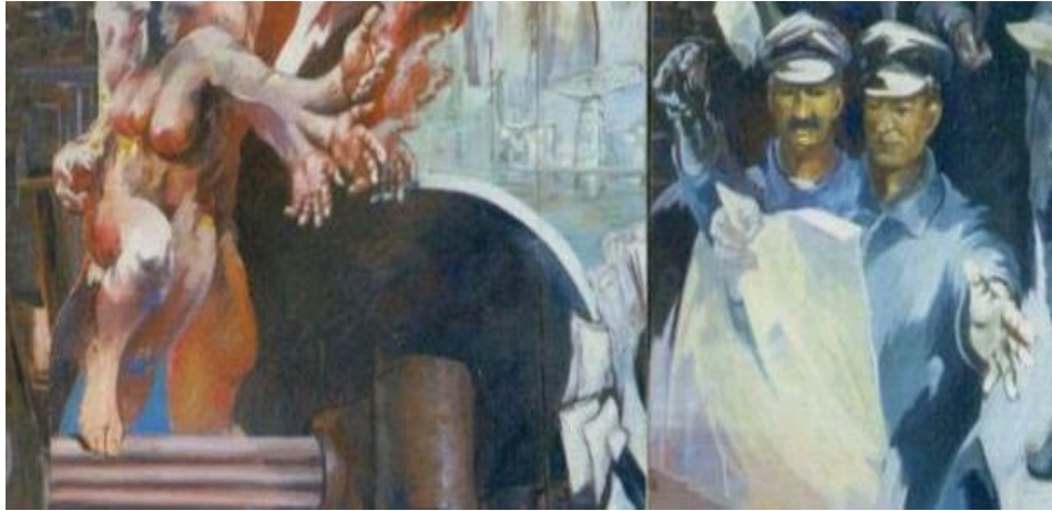
Kunstwerk auf dem Iltis- Bunker erregt der Zorn der grüne Frauen