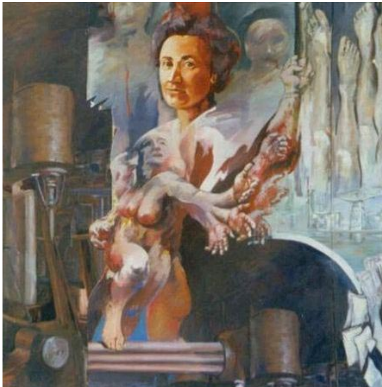
Dieses Bild auf dem Iltis- Bunker bringt die Grünen- Frauen in Rage