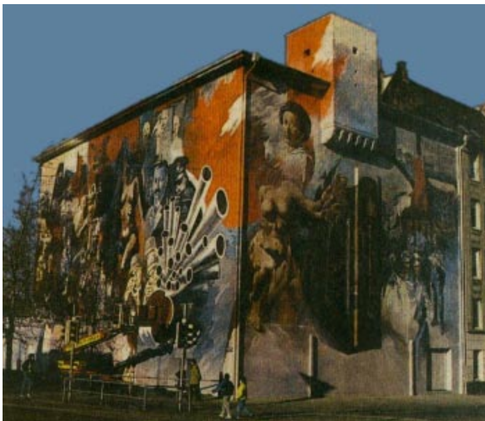
Aus diesem Blickwinkel hat Künstler Charmi die Bunkerbemalung an der Iltis/Preetzer Straße konzipiert